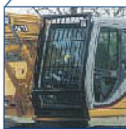
キャブプロテクタ