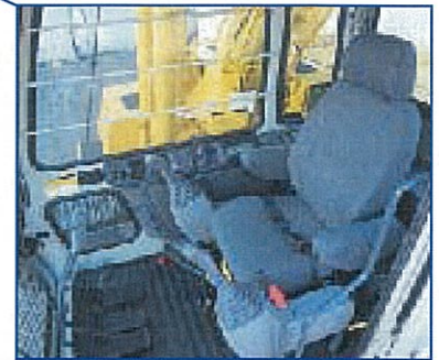
ゆったりスペースのワイドキャブ内