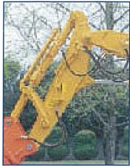
専用アーム・強化リンク