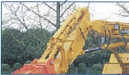
専用バケットシリンダ・損傷防止ガード